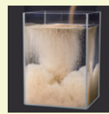
• Pas de grumeau.