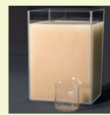
• Bouillie homogène : peu de produit résiduel dans l'emballage.