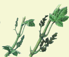
Boutons floraux séparés